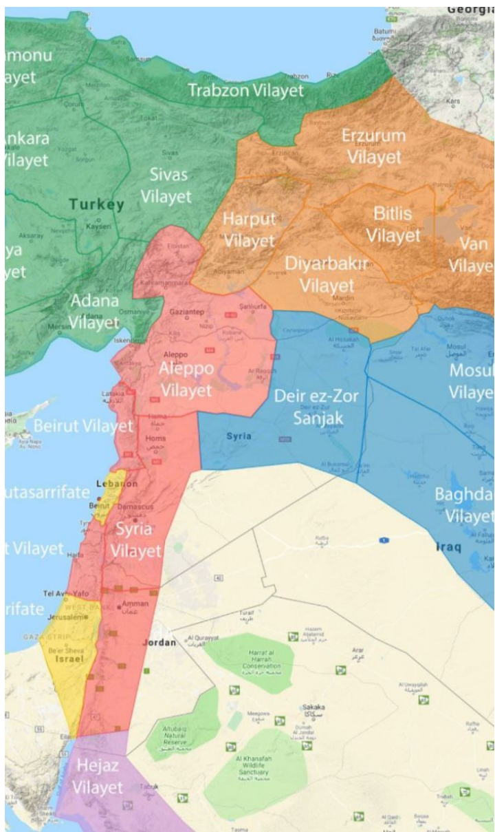
Административное деление Османской империи в начале XX века...